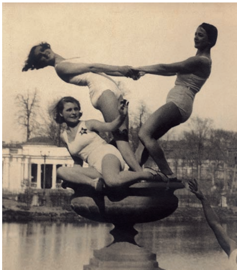
Евгений Корбут Гимнастический этюд Конец 1920-х