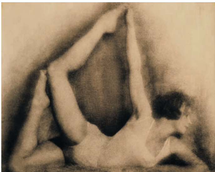
Слева вверху Юрий Еремин Ню. Этюд. 1924