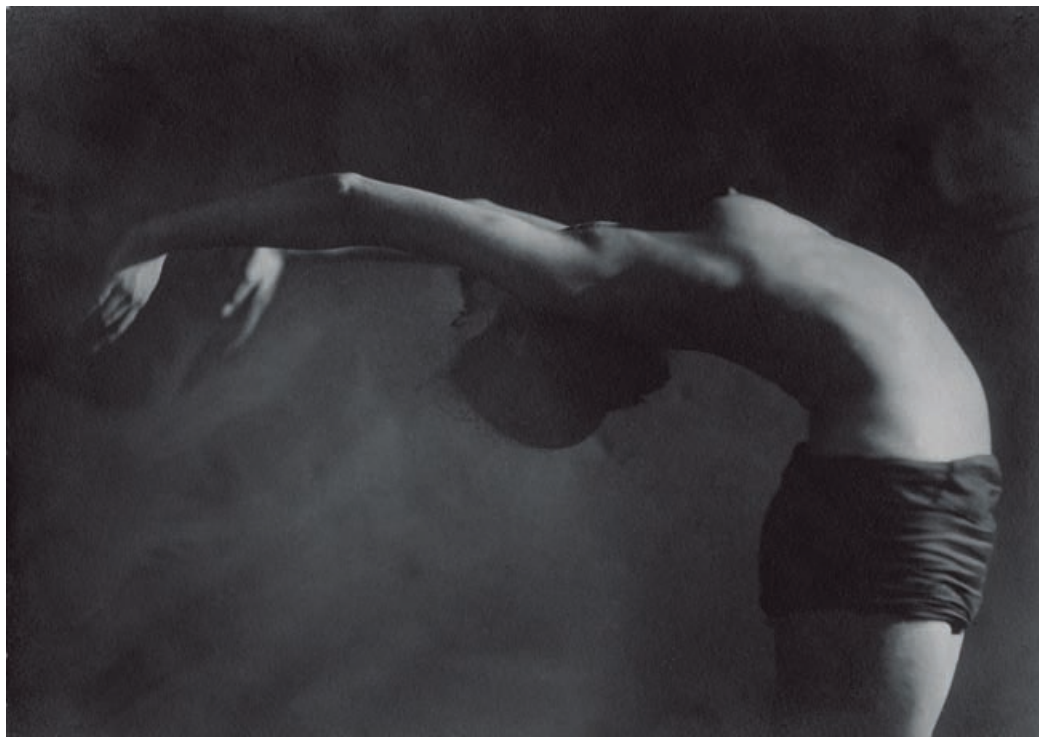
Николай Власьевский Пластический этюд 1920-е