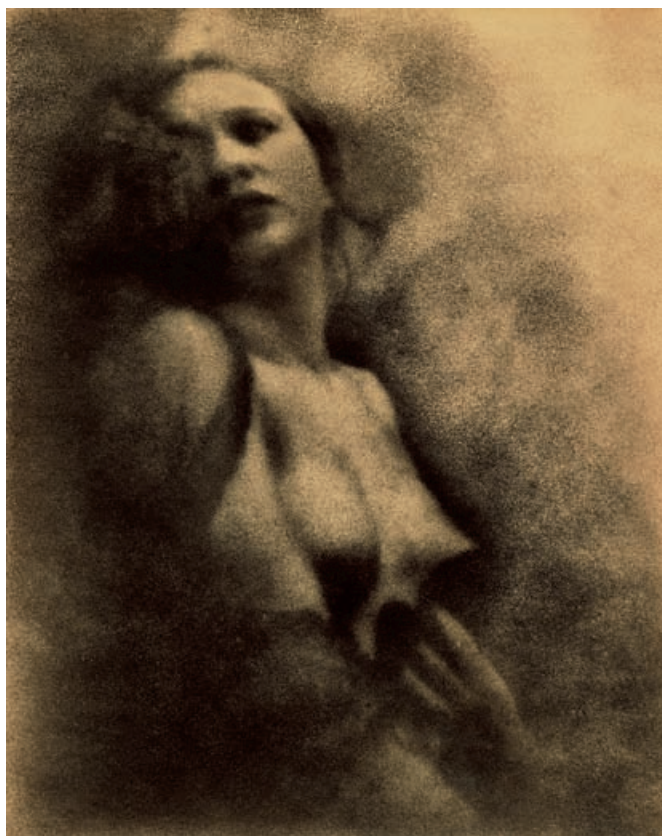
Александр Гринберг Пластический этюд Конец 1920-х

Ню (фр. nu – нагой, обнаженный) – жанр в изобразительном искусстве, посвященный обнаженному (преимущественно женскому) телу, его художественной интерпретации