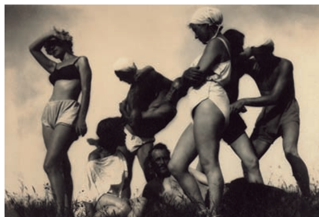
Александр Гринберг Гимнастический этюд Начало 1930-х