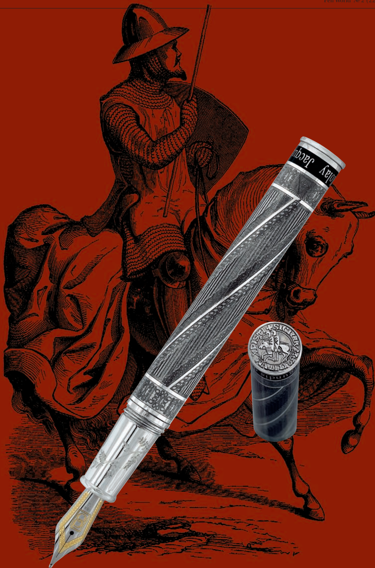
Fig. 16 —Knight in War-harness, after a Miniature in a Psalter written and illuminated under Louis le Gros.