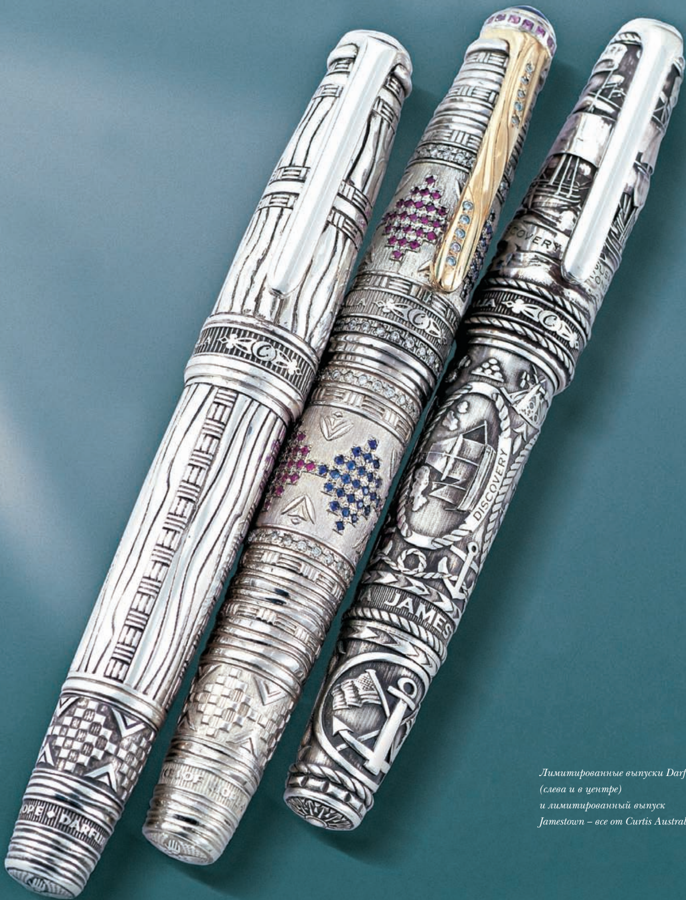
Лимитированные выпуски Darfur (слева и в центре) и лимитированный выпуск Jamestown – все от Curtis Australia