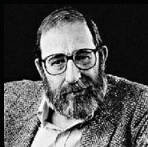
Альваро Сиза Виера