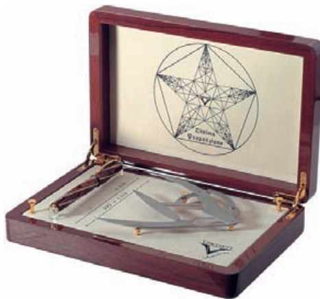
Оригинальная упаковка ручки

Divina Proportion HRH – восьмая ручка комплекта HRH и первая с бриллиантовым покрытием пера. Инкрустация из более чем пятидесяти белых бриллиантов украшает необычное 18-каратное покрытие каждой из шестидесяти перьевых ручек белого и шестидесяти ручек желтого золота. Дель Веккио уверяет, что бриллиантовое покрытие абсолютно не мешает процессу письма. «Вы можете спокойно писать этим пером, а когда оно испачкается, его можно снять и почистить. Разве это не удивительно?» – восклицает он.