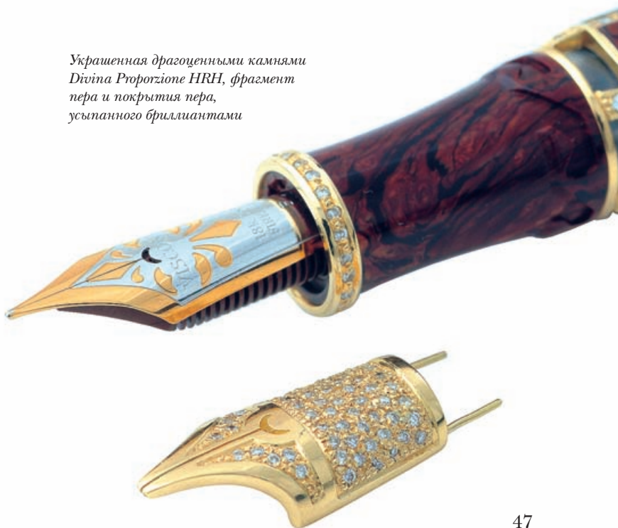
Украшенная драгоценными камнями Divina Proportion HRH, фрагмент пера и покрытия пера, усыпанного бриллиантами