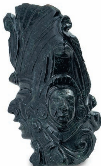
Образец черного нефрита из Центральной Америки