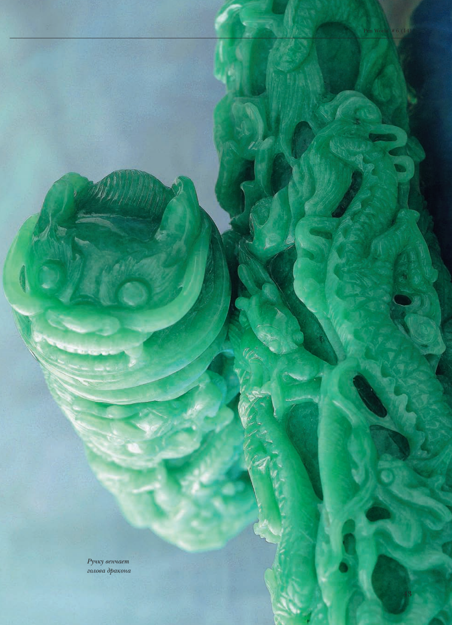
Ручку венчает голова дракона