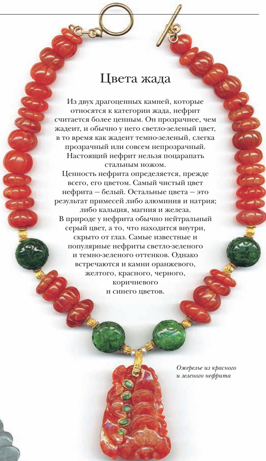
Ожерелье из красного и зеленого нефрита

Из двух драгоценных камней, которые относятся к категории жада, нефрит считается более ценным. Он прозрачнее, чем жадеит, и обычно у него светло-зеленый цвет, в то время как жадеит темно-зеленый, слегка прозрачный или совсем непрозрачный. Настоящий нефрит нельзя поцарапать стальным ножом. Ценность нефрита определяется, прежде всего, его цветом. Самый чистый цвет нефрита – белый. Остальные цвета – это результат примесей либо алюминия и натрия; либо кальция, магния и железа. В природе у нефрита обычно нейтральный серый цвет, а то, что находится внутри, скрыто от глаз. Самые известные и популярные нефриты светло-зеленого и темно-зеленого оттенков. Однако встречаются и камни оранжевого, желтого, красного, черного, коричневого и синего цветов.