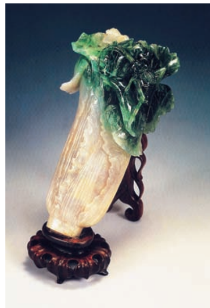
Китайская капуста, вырезанная из нефрита смешанного цвета – коллекция Пекинского музея Гугун (Запретный город)