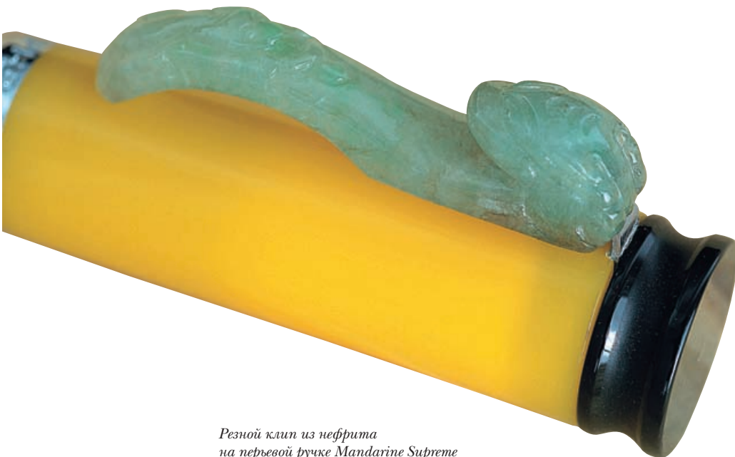
Резной клип из нефрита на перьевой ручке Mandarin Supreme от Loiminchau