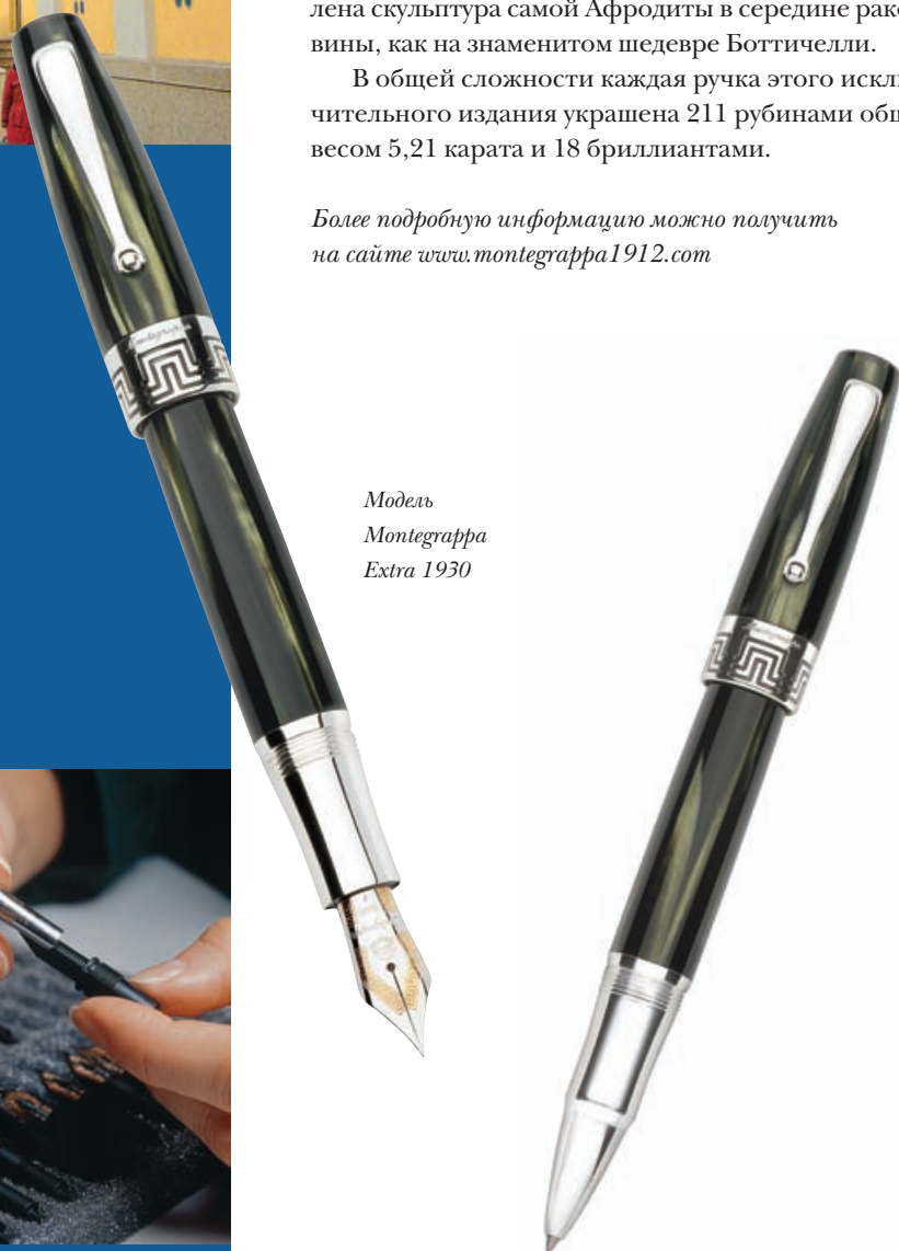
Модель Montegrappa Extra 1930

Более подробную информацию можно получить на сайте www.montegrappa1912.com